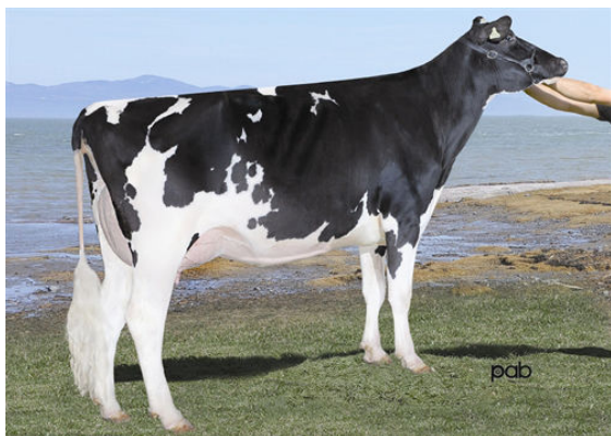
WABASH-WAY-I SHOTTLE EMBER GRANDDAM